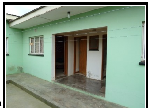
Illustration 5: Mein Zimmer von Außen

kleinen Raum zu machen. Daran habe ich mich aber mittlerweile gewöhnt und finde es auch nicht mehr schlimm.