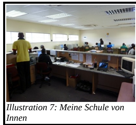
Illustration 7: Meine Schule von Innen