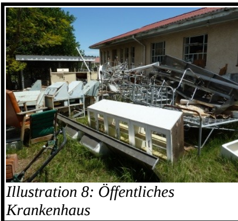
Illustration 8: Öffentliches Krankenhaus

Nach der Arbeit kann man hier leider so gut wie gar nichts machen. Es ist abends zu gefährlich draußen herum zu laufen. Daher sitze ich meistens in meinem Zimmer und lese oder erstelle mit Mcido den Unterricht für den nächsten Tag. Mcidos´ Zimmer ist wie meines und beide sind auf dem gleichen Grundstück. Insgesamt gibt es drei Zimmer welche vermietet werden, aber das dritte steht leer.