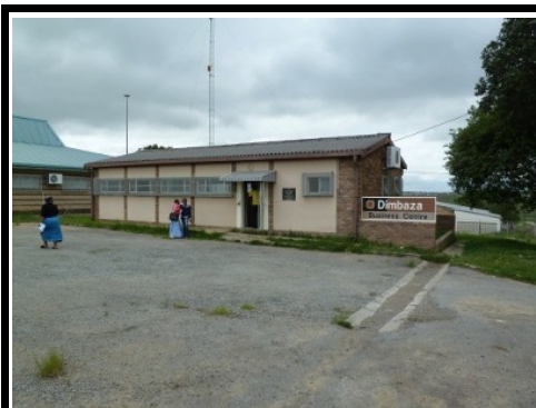
Illustration 6: Meine Schule von Außen

Ich unterrichte in Dimbaza eine kleine Business-Schule mit vier Klassen pro Tag in Excel, Word, Powerpoint, Internet und E-Mail. Mein Arbeitstag geht von 8:30 bis 12:30 Uhr. Dann ist eine Stunde Mittagspause und danach ist wieder von 13:30 bis 17:30 Uhr Unterricht. Nach dem 3-monatigen Kurs bekommen die Teilnehmer ein Zertifikat, mit dem Sie erheblich bessere Chancen haben einen neuen Beruf zu bekommen.